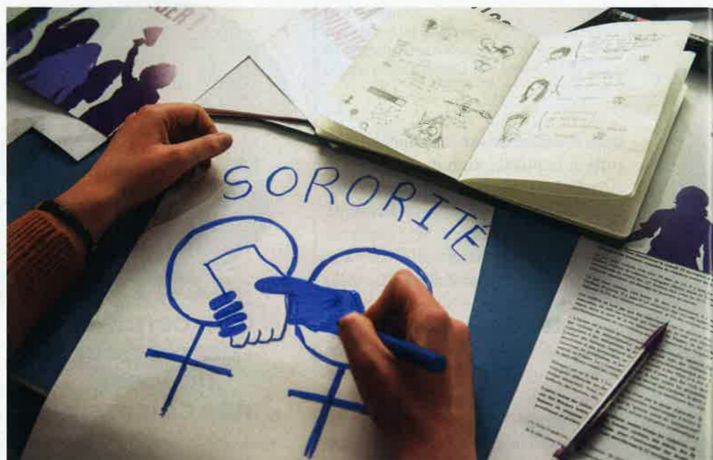
Selon Manéli Farahmand, «les cercles de femmes répondent à cette quête de sororité dans les expériences corporelles et émotionnelles».

dévalorisé par les monothéismes», poursuit Irene Becci. Ce n'est d'ailleurs pas un hasard si ces spiritualités réaménagent des rituels précisés autour du corps féminin comme la bénédiction de l'utérus ou lors de moments charnières comme la ménopause. «Les cercles de femmes répondent à cette quête de sororité dans les expériences corporelles et émotionnelles, atteste Manéli Farahmand. Dans ces milieux, le féminin sacré est vu comme accompagnant des processus de guérison émotionnelle ou d'empowerment.» La professeure Irene Becci observe que cette mouvance autour du féminin sacré est très proche de l'écoféminisme. «Dans cette approche, la terre est un peu violée et malmenée, comme le sont les femmes et leur corps, relève-t-elle. En sacralisant la terre, on en vient également à sacraliser le féminin.» «Fleurissant généralement hors des structures traditionnelles du christianisme, ces spiritualités féministes com-