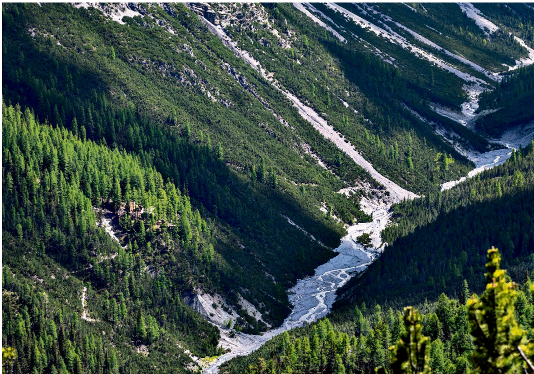
NATURE Au cœur des Alpes, dans un val sauvage, se trouve la plus pittoresque des deux seules possibilités d'hébergement du Parc naturel suisse: Chamanna Cluozza. Dans ce refuge accessible uniquement aux randonneurs, pas de réseau téléphonique, pas d'internet, pas de foule. Reportage. (VAL CLUOZZA, 2022/SNP)