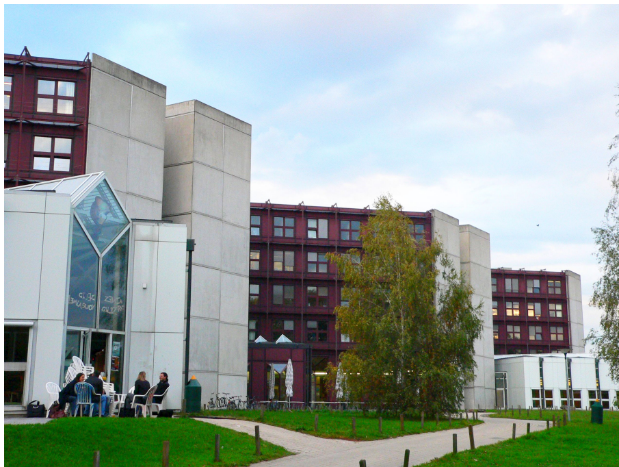
Le bâtiment Anthropole, de l'UNIL.